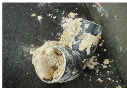
油による排水の詰まり